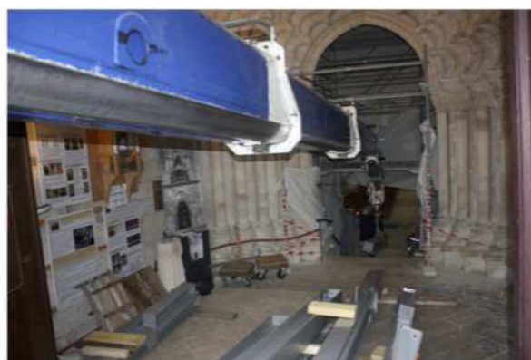
Vision étonnante: une grue télescopique fait pénétrer des éléments de la tribune dans l'église

La construction d'une tribune qui accueillera l'orgue au-dessus de l'entrée de l'église se poursuit. L'église étant classée Monument Historique, la conception et la construction de cette tribune ont connu un long et complexe processus, impliquant de nombreux interlocuteurs... De fait, l'échéancier initial ne peut pas être tenu.