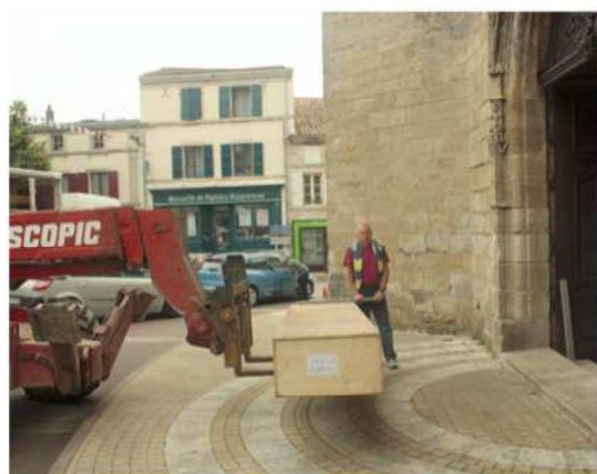
Arrivée devant la porte de l'église d'une des caisses contenant les tuyaux

Rappelons ici qu'un orgue est dans un premier temps assemblée dans l'atelier du facteur d'orgues puis l'instrument est démonté, mis en caisse (pour les tuyaux et toutes les pièces fragiles) et remonté une fois parvenu sur son lieu de destination.