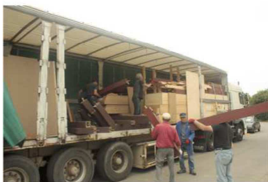
Déchargement du semi-remorque