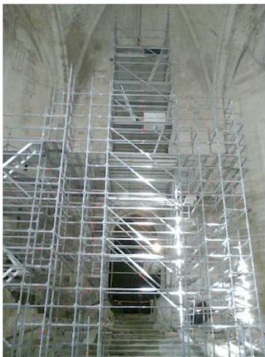
Installation de l'échafaudage utilisé pour la construction de la tribune et l'élévation du grand-orgue

Début mars, les travaux d'édification de la tribune sont néanmoins en voie d'achèvement. Les différents lots du chantier ont été attribués à des entreprises locales.