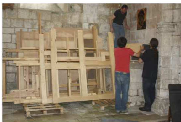
Stockage des menuiseries du buffet de l'orgue

L'instrument est actuellement soigneusement entreposé, dans l'attente de la fin de l'édification de la tribune, travaux placés sous la responsabilité de la municipalité, propriétaire de l'édifice.